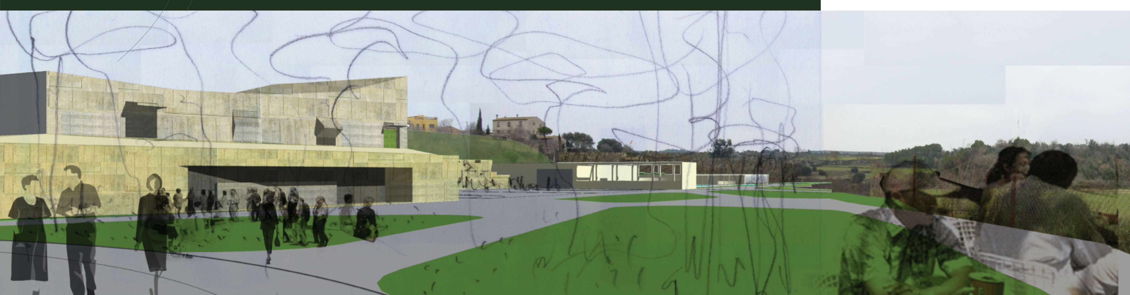
VISTA ESPAI MULTIFUNCIÓ I PISTA ESPORTIVA AMB BAR - AL FONS LES PISCINES