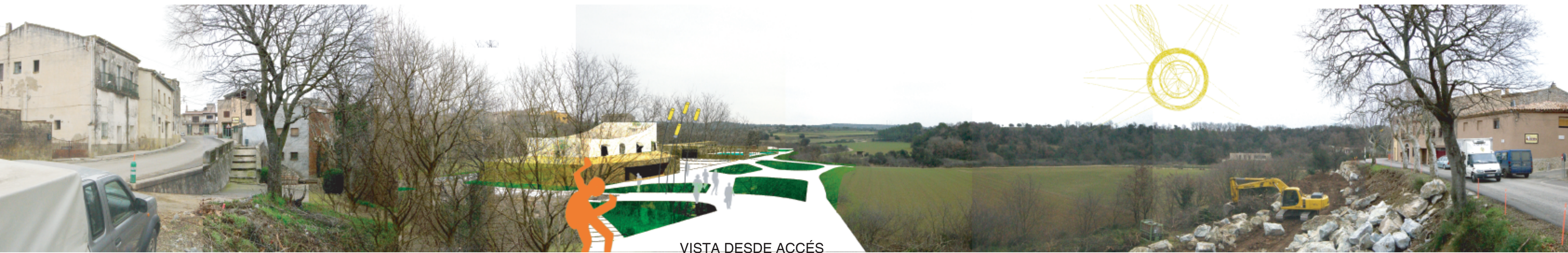
VISTA DESDE ACCÉS