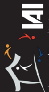
International Alliance of Inhabitants

coordination technique du concours: grup de participació, Barcelona. Mail de contact: repensarbondpastor@gmail.com