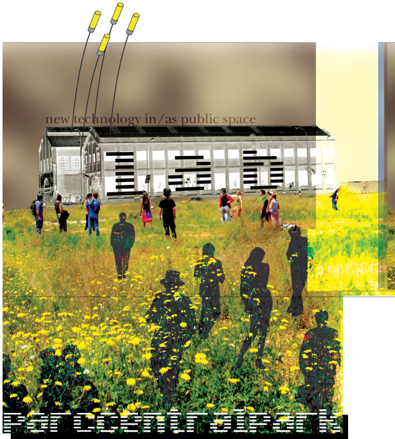
PARCCENTRALPARK_LAB : AN EMERGING URBAN KITCHEN