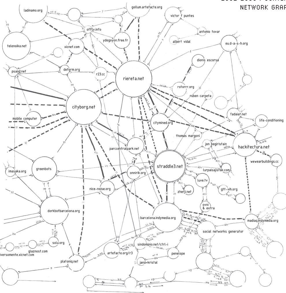
2002-2005 : CONTEXT NETWORK GRAPH

Set in the experience of this process, Context sets out to establish a fluid structure for the post-web world, relating one project with another, one group with another, and projects and groups with physical spaces. In an open, symbiotic process, the Context project was incubated and presented together with Straddle3 Constructors, making for the co-